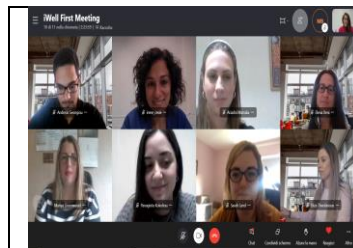
[οι εταίροι του έργου στην πρώτη τους συνάντηση, στις 18 Νοεμβρίου του 2020]